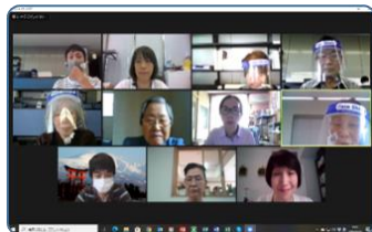
【オンライン患者会の様子】